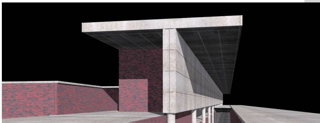
Complexo Desportivo da Alta de Lisboa Pórtico de Entrada Estudo Prévio

O AutoCAD foi desde cedo adoptado pela quase totalidade dos 9 arquitectos que compõem a equipa e que agora se familiariza com o Autodesk Revit Building , o qual tem vindo a ser utilizado como criador dos modelos conceptuais das propostas realizadas por estes gabinetes de arquitectura.