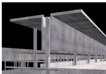
Complexo Desportivo da Alta de Lisboa Estudos para o pórtico de Entrada

“Na fase embrionária do projecto podemos em tempo real produzir estudos completos e testar as relações de massa dos objectos arquitectónicos, apresentando aos diversos interlocutores perspectivas com renderizações convincentes”, refere o arquitecto Francisco Marinho.