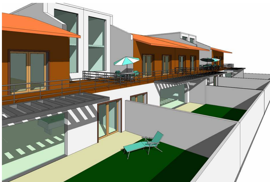
Moradias em banda