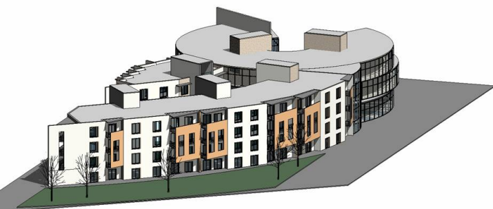
Bandas de edifícios de habitação e serviços

Por outro lado, este arquitecto considera não menos importante o facto de a visualização imediata dos modelos tridimensionais permitir que o cliente e outros membros da equipa, intervenientes na fase de concepção, tenham a correcta percepção do resultado final da proposta.