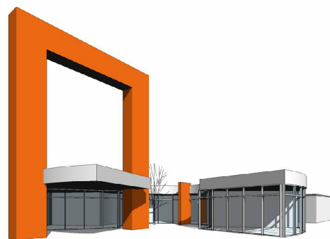
Stand temporário de vendas

Por outro lado, este arquitecto considera não menos importante o facto de a visualização imediata dos modelos tridimensionais permitir que o cliente e outros membros da equipa, intervenientes na fase de concepção, tenham a correcta percepção do resultado final da proposta.