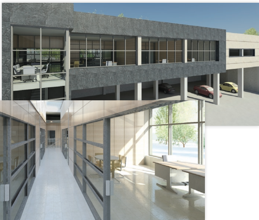
Figura 4 - Edifício de escritórios na Morelena (Projecto em REVIT)

Paralelamente à actividade empresarial, a ARQUIURB tem vindo a promover desde o início da sua actividade, uma colaboração muito forte e próxima, das instituições, associações e clubes desportivos, que se localizam na sua área de influência, a qual se tem traduzido na elaboração de Projectos de Arquitectura, os quais possibilitaram a edificação dos seus edifícios - sede. Fazendo o balanço do último biénio, 2008 e 2009 foram dois anos em que a ARQUIURB diversificou os seus projectos, dos quais destacamos, os seguintes: