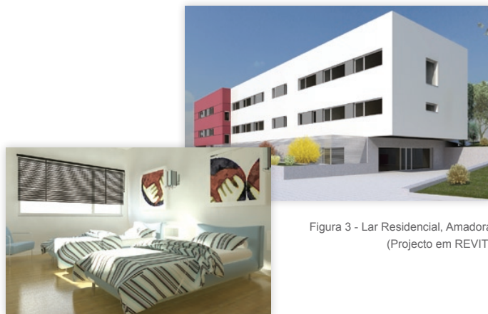
Figura 3 - Lar Residencial, Amadora (Projecto em REVIT)

pelos que a implementação da tecnologia BIM traduziu-se numa maior celeridade e rigor na elaboração de todas as fases de projecto”, afirma o Arq. Carlos Portela, referindo-se às vantagens da utilização do software Autodesk, e acrescentando ainda, relativamente às mais-valias da solução REVIT “Sendo esta uma solução mais eficiente, é objectivo do gabinete a utilização do Autodesk REVIT Architecture na execução de todos os novos projectos tornando-nos, deste modo, mais competitivos e com capacidade para superar as expectativas e exigências dos clientes.”