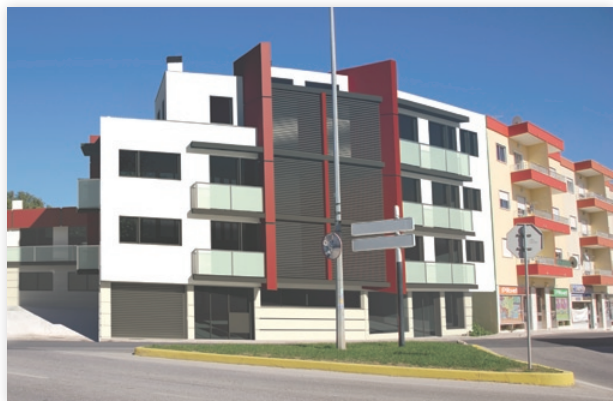
Figura 1 - Edifício Habitacional em Pêro Pinheiro (Projecto em AutoCAD e 3D Studio)

Eu não devia contar isto [risos] mas nunca comparo preços... Tenho plena consciência do excelente apoio que a TECAD nos presta e como tal, não poderia estar mais satisfeito!” .