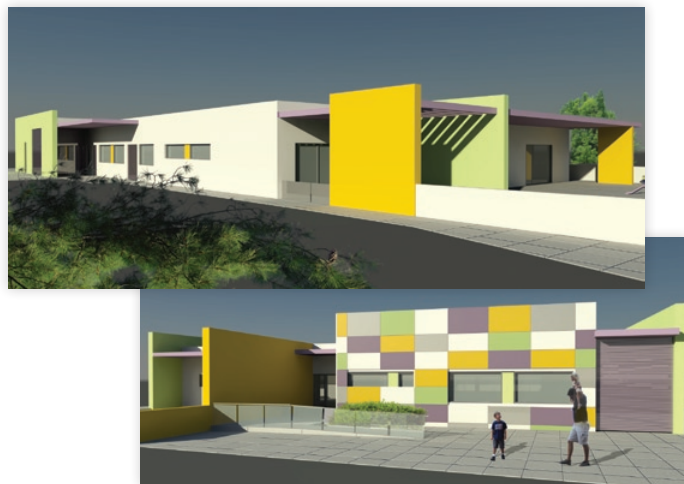
Figura 2 - Creche, São João das Lampas (Projecto em AutoCAD e 3D Studio)

“Na sequência, de uma estratégia de actuação e eficiência das suas ferramentas de trabalho, a ARQUIURB procura estar sempre na vanguarda, na utilização das Técnicas de CAD,