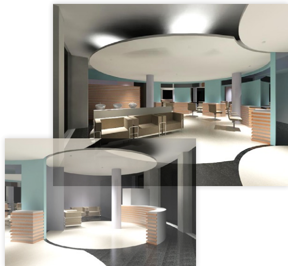
Figura 4 - Salão de Beleza - Maia

A Fróis do Amaral possui um extenso portfolio de obras de referência, executadas com recurso à tecnologia BIM e à solução Autodesk Revit, entre as quais destacamos: