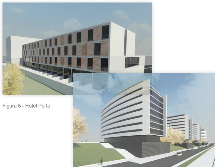
Figura 5 - Hotel Porto