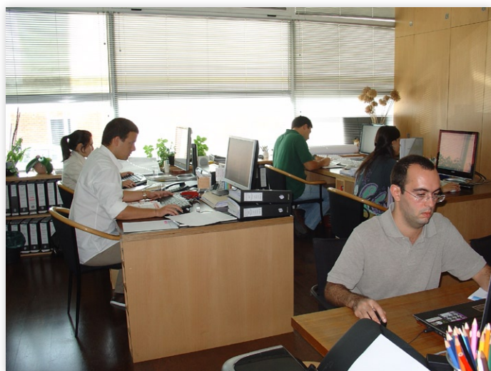
Figura 3 - Equipa Fróis do Amaral

No alçado principal, em primeiro plano foi mantido o muro existente que oculta o rés-do-chão e no piso superior foi utilizado vidro em toda a