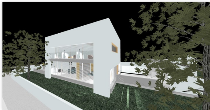
Figura 3 - Habitação Unifamiliar Matosinhos

A extensão do volume no alçado lateral e posterior foi revestido com o mesmo material de modo a manter a unidade com o conjunto edificado.