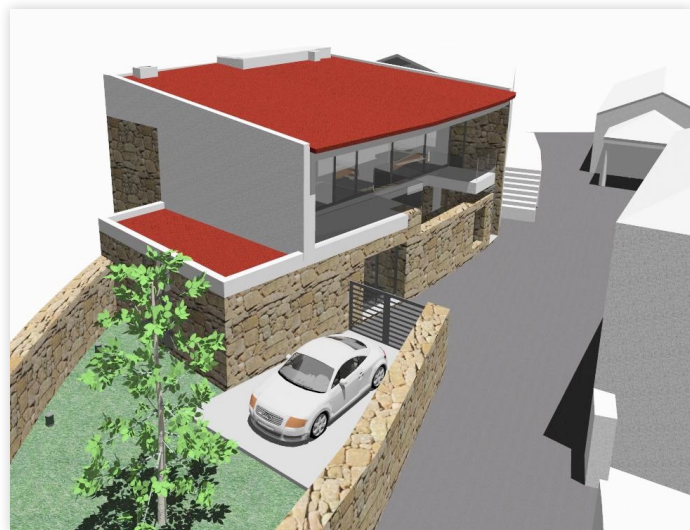
Figura 2 - Habitação Unifamiliar em Sabrosa

Contando já com um importante currículo de projectos e obras realizadas, ao longo destes anos, o gabinete tem vocacionado os seus conhecimentos para o mercado de habitação, serviços, comércio, indústria e hotelaria.