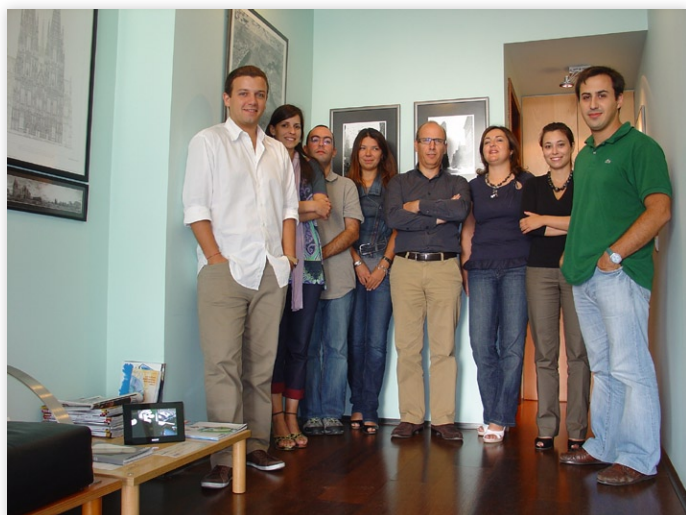
Figura 1 - Equipa Fróis do Amaral

A Fróis do Amaral Lda. foi fundada em 1996 reunindo e aglutinando experiências de pessoas que já caminhavam juntas desde 1983.